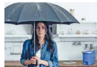
Wenn Wasser aus der Decke in die Wohnräume läuft, ist das scheinbar ein klarer Versicherungsfall. Aber nicht immer sind Versicherungen bereit, Schäden schnell auszugleichen. Wer in einer derartigen Situation kompetenten Rat braucht, kann sich an die Verbraucherzentrale wenden. Da die Wege zu den unabhängigen Beratern im ländlichen Raum mitunter sehr weit sind, helfen LandFrauenGuides vor Ort mit Erstinformationen zum Thema.

den Schaden begutachtet und auf einen anderen Betrag kommt, bleibt man in der Regel auf einem Teil der Kosten sitzen.“ Während die Schadensregulierung bei kleineren Beträgen in der Regel schnell erledigt wird, kann sich der Vorgang bei höheren Summen oder dauerhaften Zahlungen, beispielsweise im Rahmen einer Erwerbsunfähigkeit, länger hinziehen. Hier sollten Betroffene dann auf Expertenrat setzen. Neutrale Ansprechpartner finden sich beispielsweise in den Verbraucherzentralen. Wer auf dem Land lebt, kann sich auch an LandFrauenGuides vor Ort wenden, die sich mit dem Thema ebenfalls gut auskennen. txn