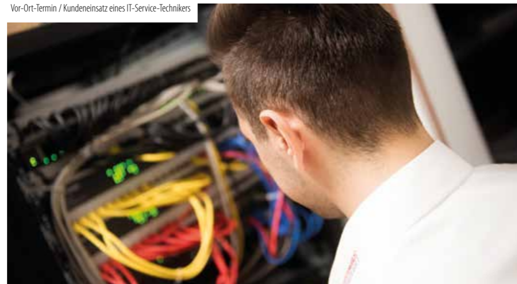
Vor-Ort-Termin / Kundeneinsatz eines IT-Service-Technikers