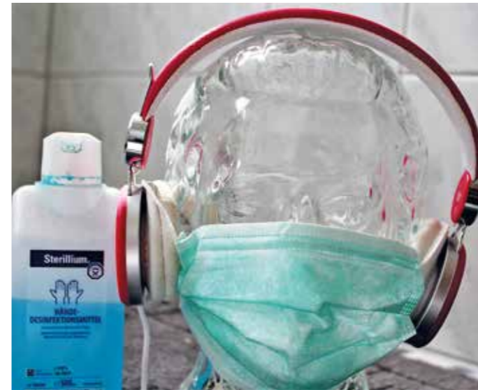
Desinfektionsmittel und Atemmaske: In der Corona-Krise sehr begehrte Produkte.

Die Deutsche Gesellschaft für Allgemeinmedizin und Familienmedizin e.V. (DEGAM) hat eine Handlungsempfehlung für die hausärztliche Praxis herausgegeben. Sie weist daraufhin, dass eine klinische Unterscheidung des Coronavirus (SARS-CoV-2) schwierig bis unmöglich ist. „Die Symptome von Patienten mit Covid-19 können unspezifisch sein