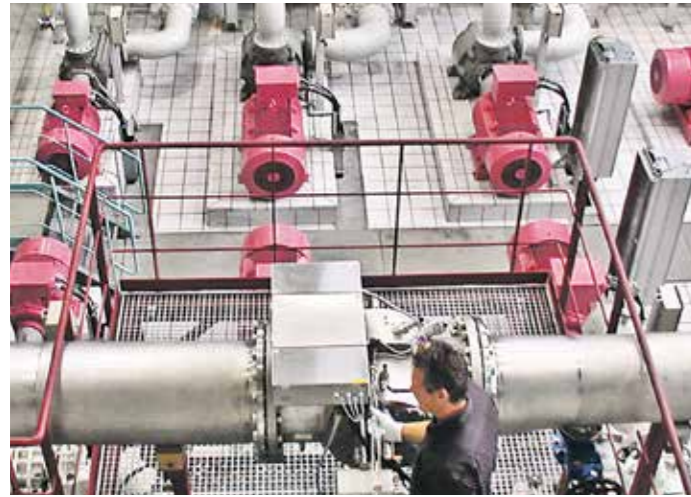
Keine Chance für Viren: Desinfektion durch UV-Licht am Ende der Trinkwasseraufbereitung. ts