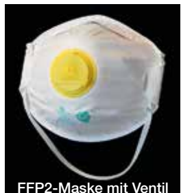
FFP2-Maske mit Ventil