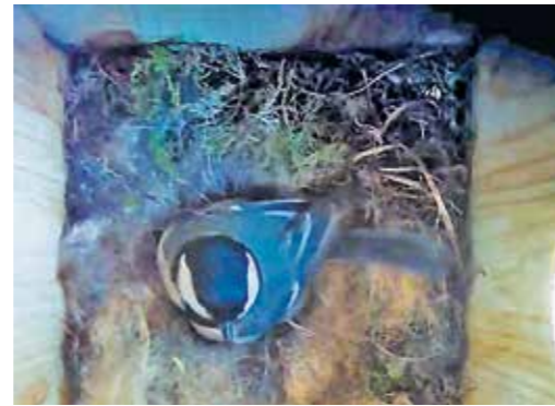
Ein Blick in das Nest der kleinen Meisen per Videokamera

jeden Tag die Fortschritte der kleinen Meisenfamilie. Das nächste Projekt ist schon geplant: in der nächsten Zeit soll auch ein Fledermauskasten aufgehängt werden, ebenfalls mit Kamera. Um sie dauerhaft mit Strom versorgen zu können, sollen dann beide Kästen später im Jahr möglichst einen Platz an der Herbeder Grundschule finden. Auf dem Wunschzettel stehen jetzt noch neue Kameras mit besserer Bildqualität und der Möglichkeit, direkt ins Internet zu übertragen. Wer bis dahin das Projekt verfolgen möchte, findet alle bisherigen und auch die zukünftigen Videos über die Internetseite der Herbeder Grundschule unter herbeder-grundschule.de dx