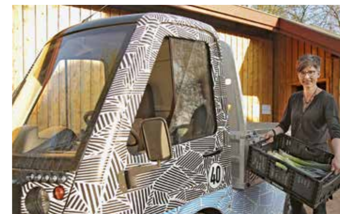
Auf dem ehemaligen Gelände des Bauunternehmens Heitkamp werden künftig kompakte Fahrzeuge unter anderem für den Einsatz in der Landwirtschaft produziert. Mit seinen Abmessungen bietet das Fahrzeug neue Möglichkeiten der Versorgung für die letzte Meile.

Die kontaktlosen Gemüse-Lieferungen erfolgen montags und freitags und können vorab im Internet individuell zusammen gestellt werden. Alle Infos dazu gibt es unter www.wirgemuese.de . Das Liefergebiet erstreckt sich auf einen Radius von rund sieben Kilometer rund um den Annener Berg in Witten. Außerdem gibt es eine Abholstelle für das Gemüse im Unikat-Kulturzentrum in der Wittener Innenstadt, Bahnhofstraße 63.