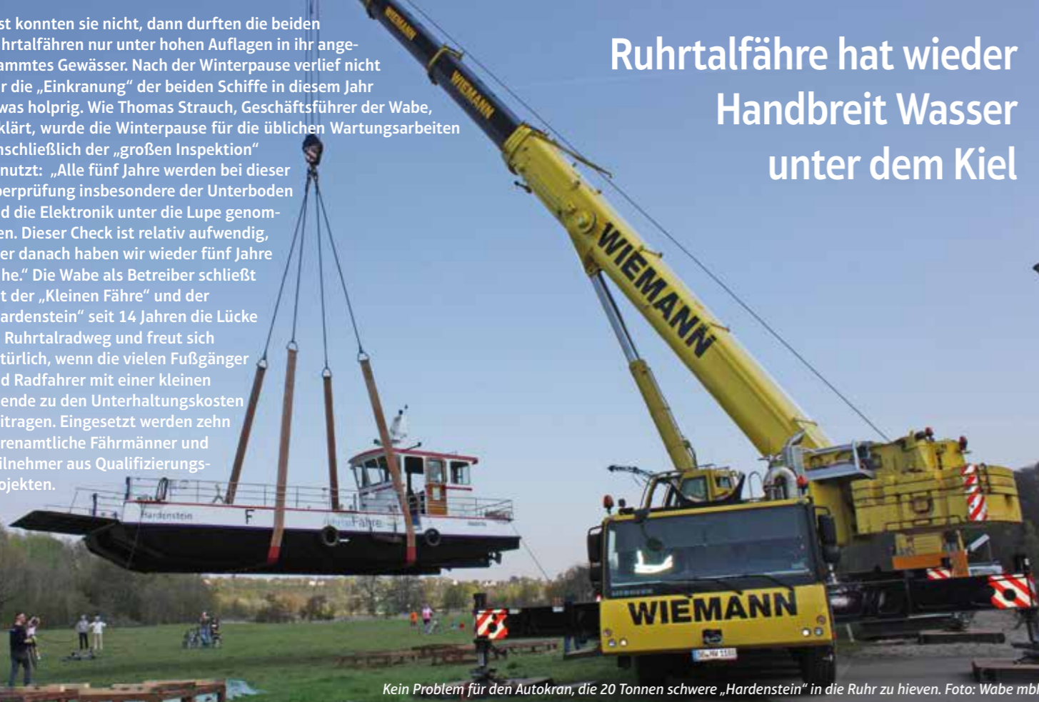
Kein Problem für den Autokran, die 20 Tonnen schwere „Hardenstein“ in die Ruhr zu hieven.

Wäre alles planmäßig gelaufen, hätten die Fähren am 1. April erstmals in diesem Jahr wieder Wasserberührung gehabt. Es hat nicht sollen sein: zuerst führte die Ruhr Hochwasser, dann wurde auch einer der Schiffsführer vom Regierungspräsidium Düsseldorf krank. Nachdem sich Wasser und Krankheit wieder normalisiert hatten, wurde Dienstag, 7. April, als Nachholtermin ausgeguckt. Tatsächlich klappte es dann einen Tag später - immerhin rechtzeitig vor Ostern.