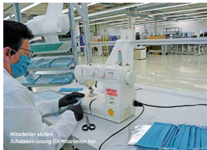
Mitarbeiter stellen Schutzausrüstung für Mitarbeiter her.