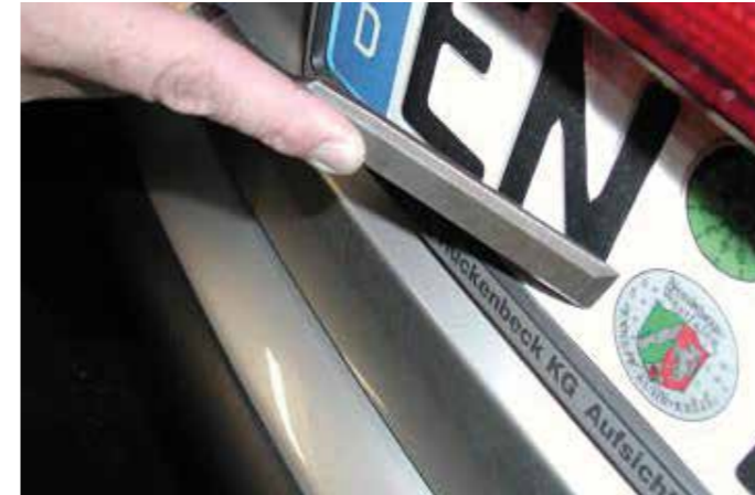
Jetzt wird es ernst: Wenn der Außendienstmitarbeiter der Kreisverwaltung das Siegel vom Kennzeichen entfernt, ist für jeden erkennbar: Das Fahrzeug darf im Straßenverkehr nicht mehr bewegt werden.

Auch zu generellen Fragen zur Arbeit des Deutschen Roten Kreuzes in Witten und den aktuellen Neuigkeiten rund um die COVID-19 Entwicklung sind die Türen an der Hauptstraße 25 immer geöffnet. Wenn Wittener kreative Projektideen haben, finden sie beim DRK ein offenes Ohr. „Auch die soziale Arbeit steht vor großen Herausforderungen bezüglich der aktuellen Situation, die wir so nicht kennen“, hält Schopp fest. dx