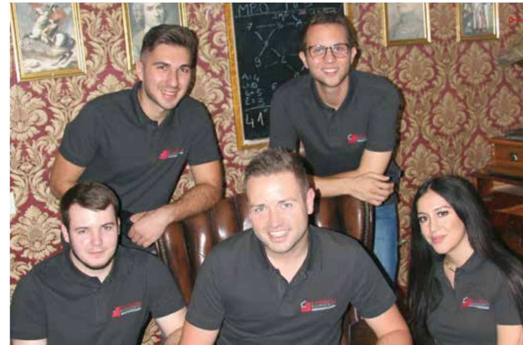
Teil des IT-Systemhaus Ruhrgebiet Teams bei Firmenevent: Escape-Room in Bochum 2019