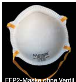
FFP2-Maske ohne Ventil