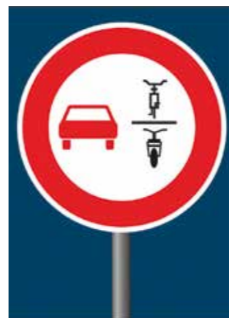
▲ Überholverbot von einspurigen Fahrzeugen Anfang

Die bereits im Februar vom Bundesrat mit Änderungen verabschiedete Novelle der Straßenverkehrsordnung (StVO) ist in Kraft getreten, es gelten vor allem neue Maßnahmen zur Steigerung der Verkehrssicherheit sowie eine Verschärfung des Bußgeldkataloges. Mit einer Verschärfung des Bußgeldkataloges werden vor allem die verkehrssicherheitsrelevanten Verstöße intensiver geahndet: Bis zu 100 Euro kann jetzt das Fahren mit E-Scootern auf Gehwegen kosten. Auch das Parken ohne Parkschein, Zweite-Reihe-Parken, Parken an unübersichtlichen Kurven und auf Carsharing-Plätzen, vor Feuerwehruzufahrten sowie das Behindern von Rettungsfahrzeugen wird künftig deutlich teurer. Für diese Verkehrsverstöße werden die Geldbußen auf bis zu 100 Euro erhöht. Die StVO sieht eine Vielzahl neuer Verkehrsschilder vor. So kann das Überholen von Fahrrädern, Mofas und Elektrokleinstfahrzeugen an Gefahrenpunkten untersagt werden. Ebenfalls neu: Das spezielle Sinnbild „Lastenfahrrad“, welches für Parkflächen und Ladezonen vorgehalten wird, sowie die neuen Verkehrszeichen für Parkflächen für elektrisch betriebene Fahrzeuge, Radschnellwege sowie die Errichtung von Fahrradzonen. In der StVO-Novelle wird zudem festgeschrieben, dass Blitzer-Apps während der Fahrt nicht verwendet werden dürfen. ampnet/deg