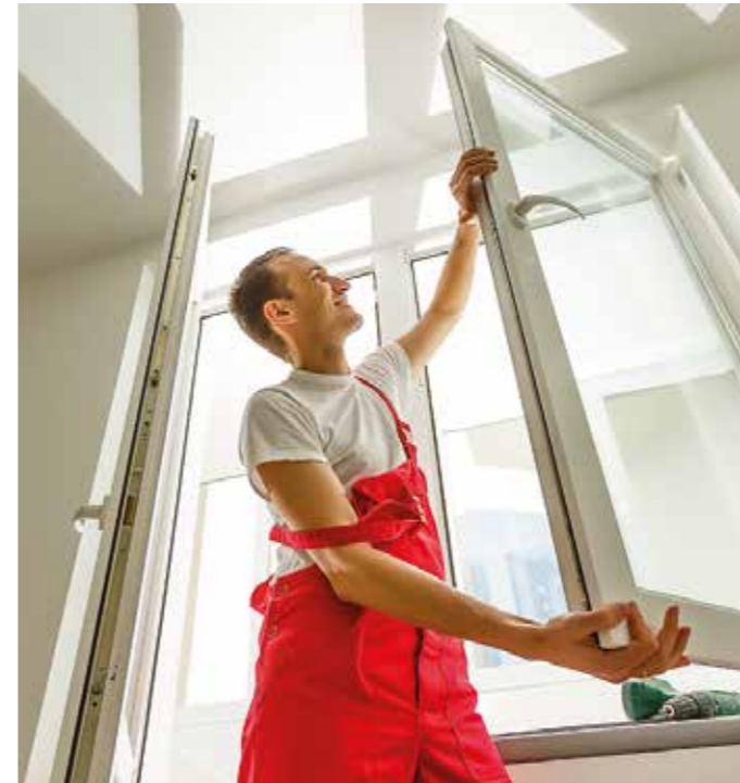
Auf die Reihenfolge kommt es an: Bei der energetischen Sanierung empfiehlt es sich oft, erst die Fenster auszutauschen und danach die Heizung zu modernisieren.