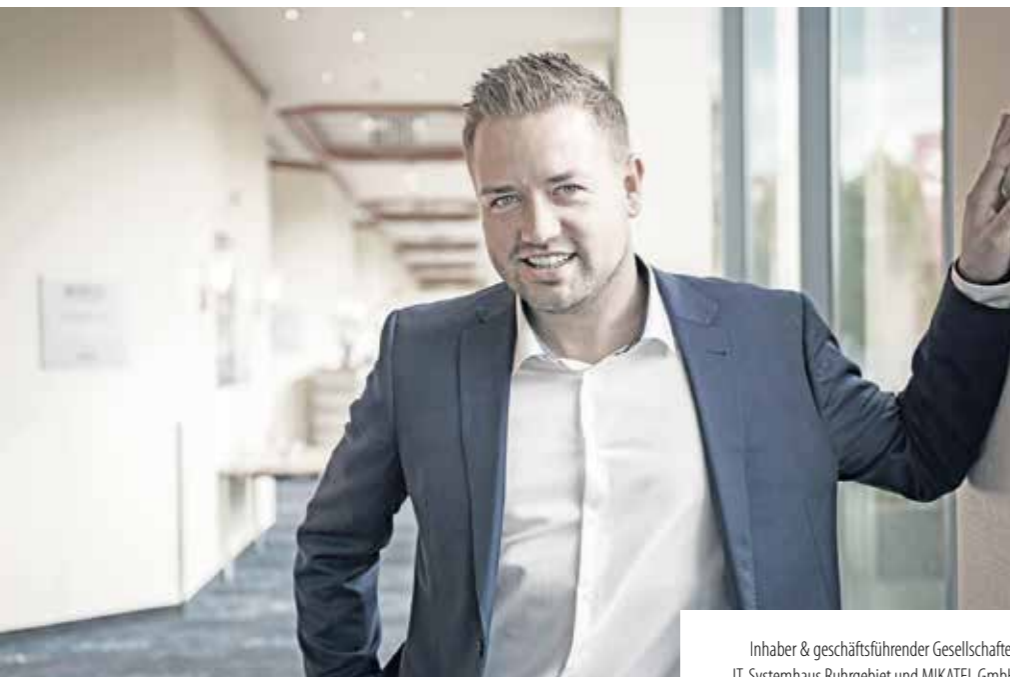
Inhaber & geschäftsführender Gesellschafter IT-Systemhaus Ruhrgebiet und MIKATEL GmbH

Cloud-Technologie ist der neue Standard der Mittelstands-IT. ITSr ist seit 2005 Vorreiter und Pionier im Bereich Cloud-Computing.