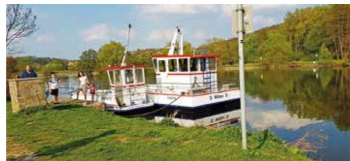
Ruhrtafelfähren schon nach zwei Tagen wieder ausser Betrieb