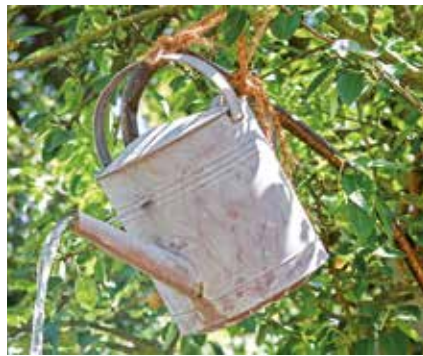
So geht's auch, aber mit beschränkter Kapazität. Besser: Regen sammeln mit Hilfe moderner Entwässerungssysteme: eine umweltfreundliche und auch kostengünstige Alternative zur Gartenbewässerung mit Trinkwasser.

Clevere und sparsame Gartenliebhaber, die ihre grüne Oase mit gesammeltem Regen bewässern, wünschen sich – besonders im Hochsommer – mehr Regen als beispielsweise Freibadfreunde oder andere Sonnenanbeter. Regenwasser ist ein kostenloser und ökologisch sinnvoller Ersatz für teures Leitungswasser ist: „Wer Regen sammelt, schont Umwelt und Geldbeutel zugleich“, wissen die Experten von „Dach.de“. Wenn mal der „große Regen“ kommt und es vielerorts „Land unter“ heißt, hilft die Lösung mit Dachrinne, Fallrohr und Regentonne. Wird der Füllstand bei andauerndem Regen nicht überprüft, läuft die Tonne über und verwandelt Beet und Rasen in eine „Wasserlandschaft“. Dagegen schaffen „intelligente“ Dachentwässerungssysteme sichere Abhilfe: Sie leiten nur so viel Wasser in die Regentonne, wie dort auch Platz hat.