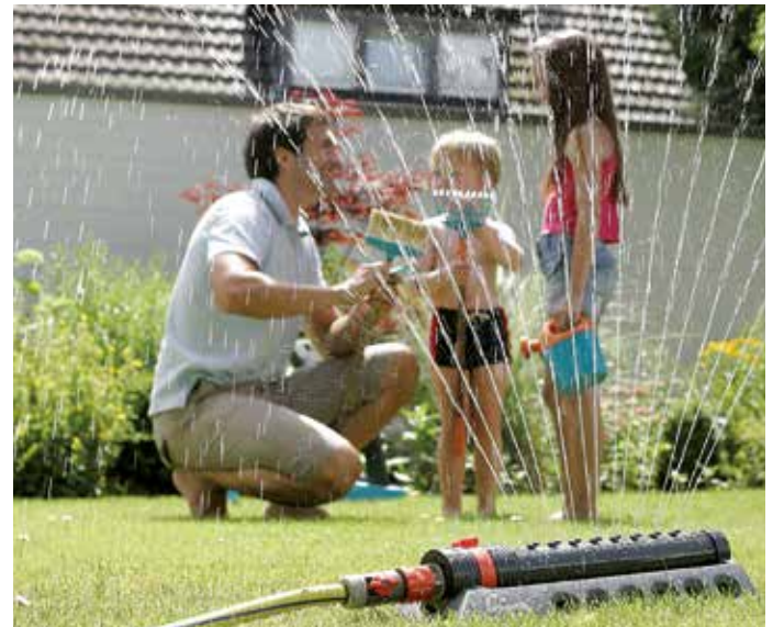
Große rechteckige Gartenflächen lassen sich am besten mit einem „Viereck-Regner“ bewässern. Kindern bietet das Gerät außerdem jede Menge Wasserspaß: An heißen Tagen können sie durch die Wasserstrahlen springen und sich dabei angenehm erfrischen.

Abend zu erledigen. Wer keine „Urlaubsvertretung“ fürs Gießen findet, kann sich schnell und bequem sein eigenes Bewässerungssystem für Kübelpflanzen und Balkonkästen bauen. Alles, was man dazu braucht, ist eine Plastik-Flasche – am besten mit 1,5 Liter Fassungsvermögen.