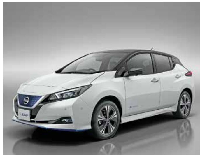
Nissan Leaf e+.

Hier hält auch Nissan-Connect-EV mit Rückfahrkamera Einzug. Das Multimedia-System mit Acht-Zoll-Touchscreen bietet ein Digital-Radio (DAB), Bluetooth-Audio-Streaming, Freisprechanlage, Sprachsteuerung, iPod-Gateway, sechs Lautsprecher sowie Apple Carplay und Android Auto. Das EV-Telematiksystem weist den Weg zur nächsten Ladestation, hilft bei der ökonomischen Routenplanung, zeigt die Reichweite an und liefert Energieinformationen und Fahreranalysen. Die Nissan-Connect-EV-App steuert unter anderem Klimaanlage und Ladevorgang. ampnet/deg