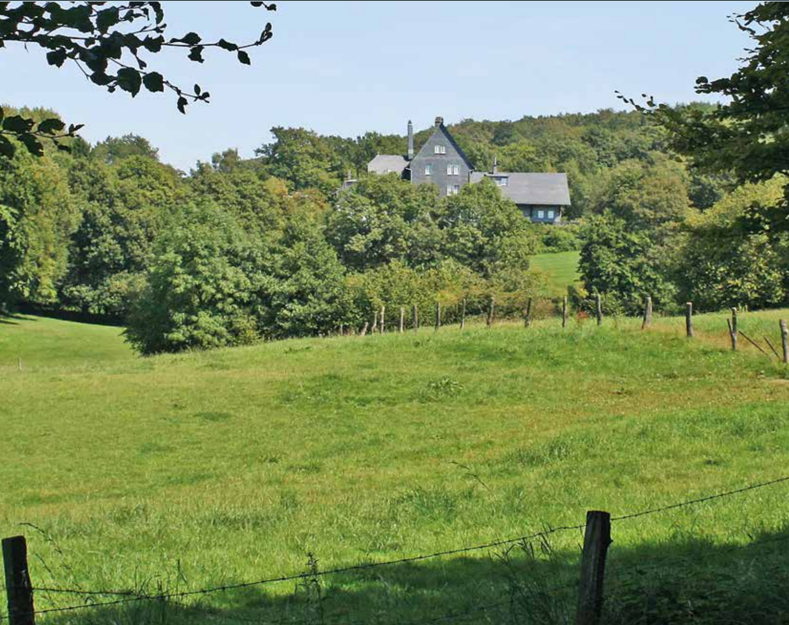
Bahnhof Schee, Archivfoto

+++ 4 MONATSMAGAZINE: GESAMTAUFLAGE CA. 90.000 EXEMPLARE +++ HAUSHALTSVERTEILUNG +++ ☎ 02302 9838980 +++ WWW.IMAGE-WITTEN.DE +++