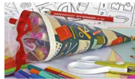
Nach dem Verzehr der Süßigkeiten aus der Schultüte steht der viel zitierte Ernst des Lebens an. Dann bestimmen Stifte, Heft und Tafel den Alltag.

Eltern sollten Schulanfang gründlich planen