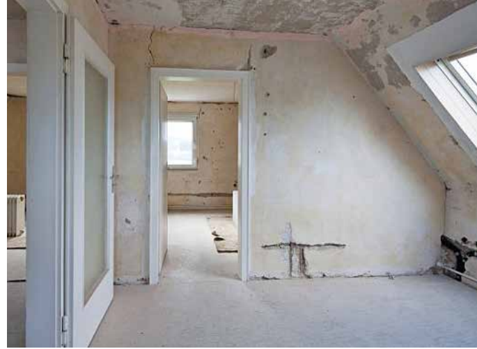
Damit das Dachgeschoss nach dem Dachausbau viel Wohnkomfort bietet, sollten Hausbesitzer vor der Sanierung ihre Vorstellungen zusammenfassen und mit einem Planer besprechen. Zu diesem Zeitpunkt werden dann auch die gesetzlichen Vorgaben und eine mögliche KfW-Förderung geprüft.