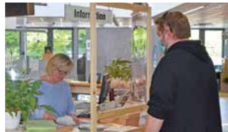
Abstand und Plexiglas schützen Mitarbeiter und Kunden sowohl an der Information als auch am Schalter, wo ihre Anliegen bearbeitet werden. Foto: UvK/Ennepe-Ruhr-Kreis

Nur wer einen ausgefüllten Online-Antrag nebst den notwendigen Unterlagen abgeben möchte, kann die Zulassungsstellen derzeit ohne Termin besuchen. Für alle anderen Anliegen gilt Terminpflicht. Gebucht werden können diese ebenfalls über die Internetseite. Alternativ geht es telefonisch unter 02336/4441151 für Schwelm und 02302/20240 für Witten.