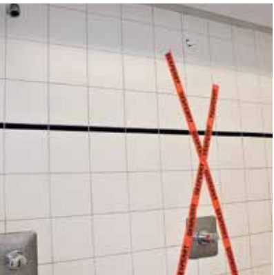
Die Schränke der Umkleiden sind gesperrt. Bei den Duschen geht es ebenfalls eingeschränkt zur Sache - es bleibt die Mitte frei und das Duschen ist ohne den fehlenden Duschkopf nicht möglich. Kommt auch keiner auf dumme Gedanken.

Rund 150 Besucher haben ihren Wochenendausflug nach Niedersprockhövel verlegt. Bei schönstem Wetter genossen sie das kühle Wasser oder sonnten sich auf der weitläufigen Liegewiese.