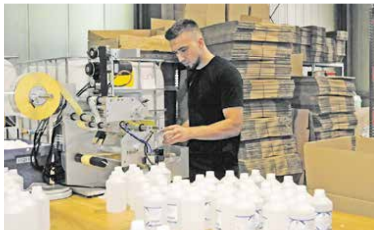
Blick in die Produktionshalle.