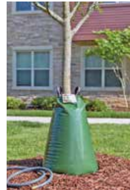
Der Sack zum Baum

Für den Ausschuss „Umwelt, Verkehr, öffentliche Sicherheit und Ordnung“ stellt die Fraktion B90/Die Grünen Sprockhövel einen Antrag für das „Team Baumpflege der Stadt Sprockhövel“.