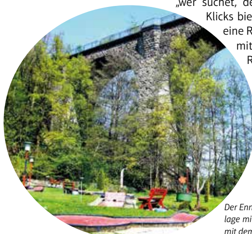
Der Ennepe-Ruhr-Kreis hat viel zu bieten. Beispielsweise die schöne Minigolfanlage mit dem alten Viadukt im Hintergrund in Gevelsberg oder die Burganlage mit dem Küsterladen in Hattingen-Blankenstein. Die Highlights im EN-Kreis gibt es jetzt digital zu bewundern. Und dann kann es losgehen.

cher noch steigen, denn alle Anbieter rund um den Tourismus können sich auch nach dem Startschuss kostenlos und unkompliziert registrieren und ihre Angebote platzieren. Mit der Seite schafft die EN-Agentur nach ennepe-ruhr-liefert.de innerhalb weniger Wochen eine zweite Online-Plattform, die gezielt darauf ausgerichtet ist, Unternehmen im Ennepe-Ruhr-Kreis zu helfen. „Natürlich setzen wir darauf, an den Erfolg der Ende März gestarteten Premieren-Plattform anzuknüpfen. Es wäre den touristischen Anbietern zu gönnen, dass sie wie Einzelhandel und Gastronomie von hohen Klickzahlen und damit verbundenen Umsätzen profitieren“, so Jürgen Köder, Geschäftsführer der EN-Agentur. Ausflugsziele finden sich auf der Webseite genauso wie Unterkünfte oder Gastronomie. anja