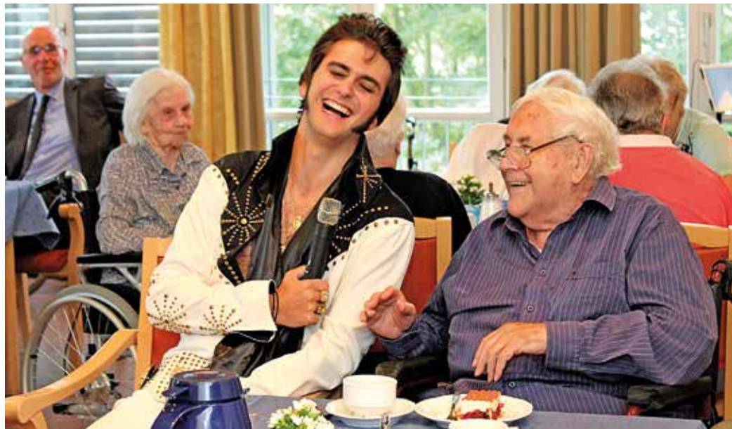
Wie möchten Menschen im Alter leben? In vielen Einrichtungen - wie hier im Haus am Quell - gehören Veranstaltungen mit Musik zur festen Programmstruktur. Hier war es ein „Elvis-Double“, der für Heiterkeit sorgte.

Das dafür ausgesuchte Grundstück war eine unbebaute Wiese, die im Flächennutzungsplan als Fläche für Gemeinbedarf ausgewiesen wurde. Um Baurecht zu schaffen, hätte ein Bebauungsplan unter der Bezeichnung „Dellwig II“ aufgestellt werden müssen. Die Planungen waren umfangreich angelegt. Die Servicewohnungen sollten in unterschiedlichen Größen entstehen – von einem Ein-Zimmer-Appartement mit etwa 40 Quadratmetern bis zu Zwei- bis Drei-Zimmer-Wohnungen von 60 bis 80 Quadratmetern. Geplant waren weiter zwei Wohngruppen mit je zwölf Plätzen sowie eine Tagespflege und ein Dienstleistungspavillon mit Kiosk, Bäcker und Café. Auch die Synergieeffekte mit dem Haus am Quell waren wünschenswert. In der damaligen Sitzung des Sozialausschusses stimmten SPD, CDU, FDP und WFS auch für eine Empfehlung des Projektes an den Stadtentwicklungsausschuss. Die Grünen waren strikt dagegen.