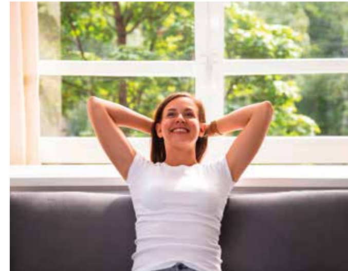
Fenster mit Wärmeschutzverglasung schließen dicht, sodass weniger Zugluft entsteht.