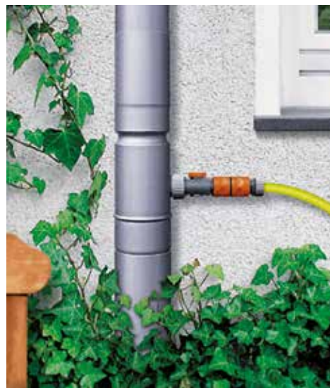
Die „intelligente“ Entwässerungssysteme leiten nur so viel Wasser in die Tonne, wie dort auch Platz hat.

Viel handwerkliches Geschick braucht es für die Installation nicht: Zuerst sägt man ein Stück aus dem Fallrohr heraus und ersetzt es durch den Regensammler. Dieser wird über einen herkömmlichen Gartenschlauch mit der Tonne verbunden, die in einem Abstand von bis zu fünf Metern vom Fallrohr entfernt stehen kann. Damit das System einwandfrei funktioniert, gilt es zwei Regeln zu beachten. Punkt eins: Die Ableitung am Fallrohr muss mindestens so hoch liegen wie die Einleitung an der Tonne. So gelangt das Wasser zwar in die Tonne, aber nicht mehr zurück. Laub und sonstiger Schmutz werden hingegen sofort ins Fallrohr geleitet. Warum läuft die Tonne aber nicht über? Geheimnis Nummer zwei liegt in der Platzierung des Tonnenzuflusses. Dieser sollte mindestens sieben Zentimeter unter dem Rand liegen, damit der Wasserzufluss automatisch stoppt, sobald der Pegel die