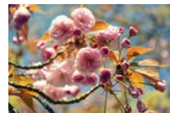
Schnell wachsende Bäume wie die Japanische Nelkenkirsche sorgen nach wenigen Jahren schon für die gewünschte Optik.

jahr jeweils kräftig zurückschneidet: Neue Triebe können dann im Herbst bereits wieder eine Länge von bis zu zwei Metern erreichen. Auch die Forsythie, der Duftjasmin oder die Zierjohannisbeere ergeben als Hecke gepflanzt schon nach wenigen Jahren einen hervorragenden und wunderschönen Sichtschutz. Mehr Infos rund um Auswahl, Pflanzung und Pflege finden Sie unter www.gruen-ist-leben.de . akz-o