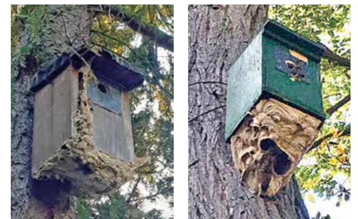
Die Wohnungsnot bei Wespen (links) und Hornissen (rechts) war offensichtlich groß, weshalb diese Insekten kurzerhand in Vogel-Nistkästen eingezogen sind.