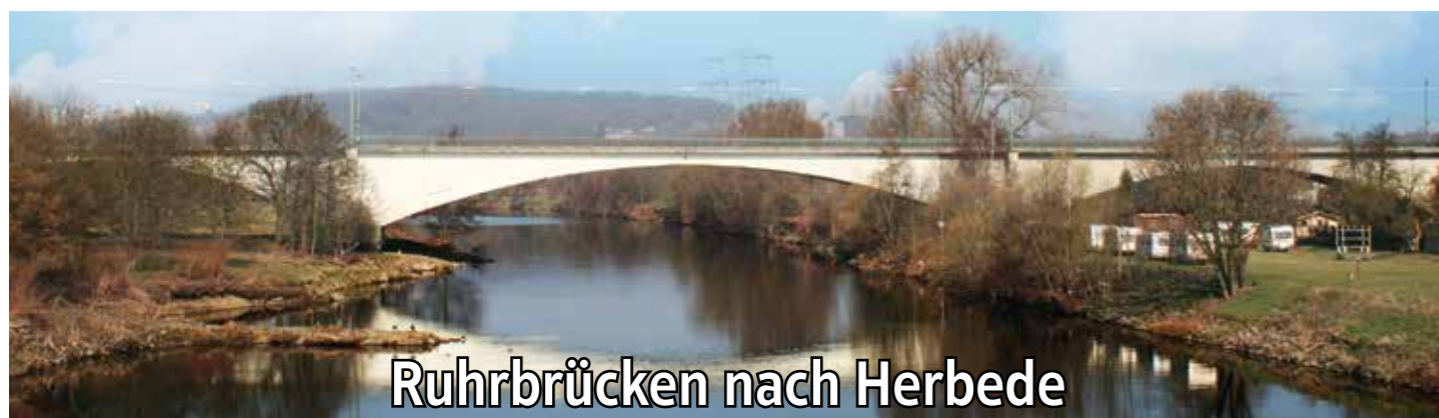
Ruhrbrücken nach Herbede

gegen eine mehrjährige Absperrung der Hauptschlagader zwischen Witten und Herbede