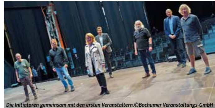
Die Initiatoren gemeinsam mit den ersten Veranstaltern.

Bochumer Künstlerinnen und Künstler, Kulturbetriebe und Kulturschaffende bekommen jetzt eine Bühne, auf der Veranstaltungen unter Coronaschutzbestimmungen stattfinden können – ein innovatives Projekt, das in der Region einzigartig ist. Bochumer Künstler und Künstlerinnen, Kulturschaffende, Kulturbetriebe, die Bochumer Veranstaltungs-GmbH (BoVG) und das Kulturbüro der Stadt Bochum arbeiten eng zusammen, um ein möglichst buntes Programm im KulturRaum Bochum zu gestalten. Über 80 Kulturschaffende und Kulturbetriebe haben gemeinsam mit der Stadt und der BoVG die Idee entwickelt; die Halle 4 der Jahrhunderthalle verwandelt sich in den KulturRaum Bochum!