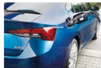
Skoda Octavia G-Tec.

Den Octavia gibt es auch wieder als Erdgasvariante G-Tec. Der 1,5-Liter-Motor wird eine Leistung von 130 PS (96 kW) und eine Reichweite im reinen Erdgasbetrieb von etwa 500 Kilometern haben. Die drei im Unterboden eingebauten Erdgastanks bunkern zusammen 17,33 Kilogramm CNG (Compressed Natural Gas). Ein neun Liter großer Benzintank ist als eiserne Reserve ebenfalls mit an Bord, der weitere bis zu 190 Kilometer Fahrt ermöglicht. Die zusätzlichen Tanks kosten rund 150 Liter Gepäckraum. Das Kofferraumvolumen beträgt 455 Liter bei der Limousine und 495 Liter beim Kombi.