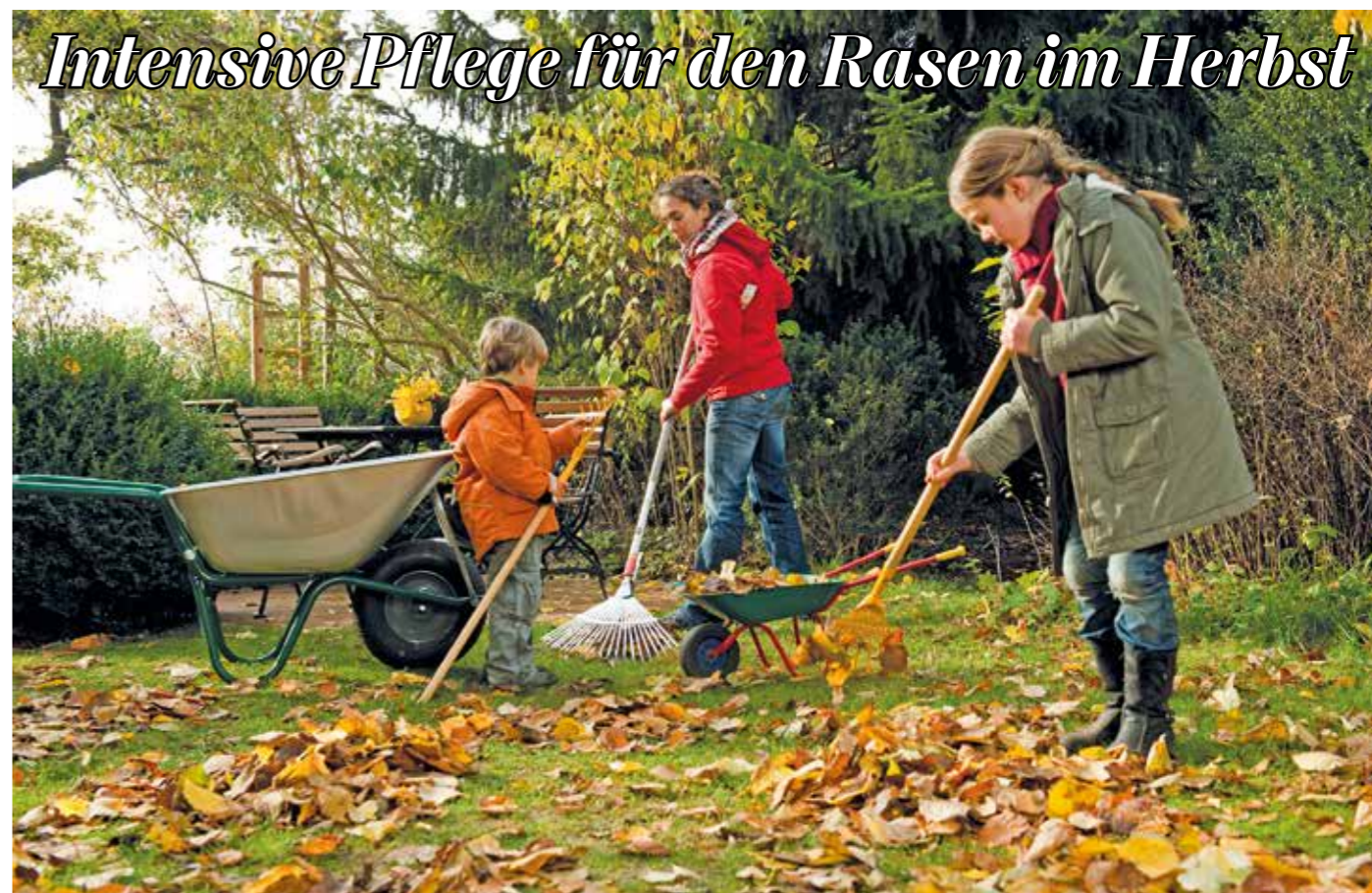
Wer auch im nächsten Jahr einen dichten, grünen und strapazierfähigen Rasen haben möchte, sollte jetzt die Zeit nutzen, um ihn auf die kalte Jahreszeit vorzubereiten.

Die oft großen Mengen von eher nährstoffarmen Herbstlaub lassen sich auf verschiedenen Wegen nutzen: So kann das Laub kompostiert werden, um später als Gartenerde in den Garten zurückzukehren. Sinnvoll ist es, andere Gartenabfälle unter das Laub zu mischen, um den Nährstoffgehalt an Stickstoff zu steigern. Stickstoff zählt für das Pflanzenwachstum zu den Basisnährstoffen. dx