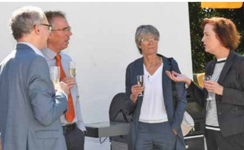
Neueröffnung Tagespflege am Mühlengraben

Im Jahr 2018 hatten fast 26.000 Menschen in Witten eine anerkannte Behinderung, davon über 17.000 mit mehr als 50 Prozent. Häufig treten die Einschränkungen mit zunehmendem Alter, etwa nach Unfällen oder Erkrankungen, auf. So sind mehr als die Hälfte der Menschen mit Behinderung über 65 Jahre alt. Behinderungen von Geburt an machen nur einen sehr kleinen Teil aus.