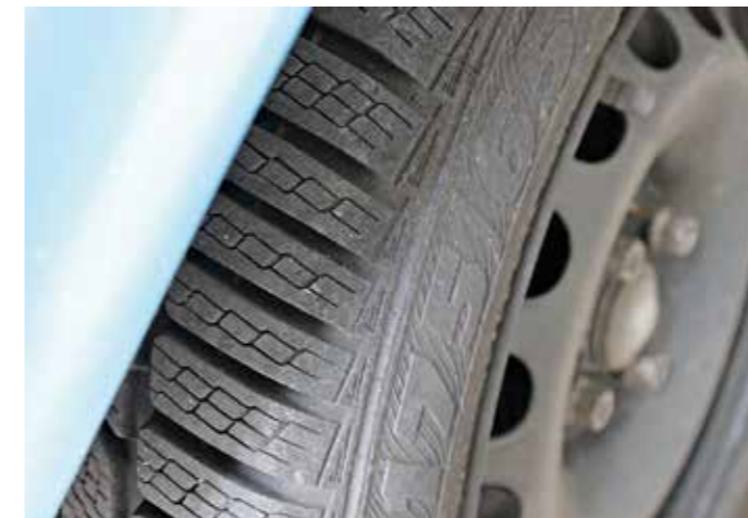
Der Reifen wird in Zukunft immer wichtiger und immer intelligenter. Ein Mikrochip kann viele Daten speichern und damit für Sicherheit sorgen.

Für optimale Sicherheit zu jeder Jahreszeit müssen die Reifen ihre Anforderungen erfüllen