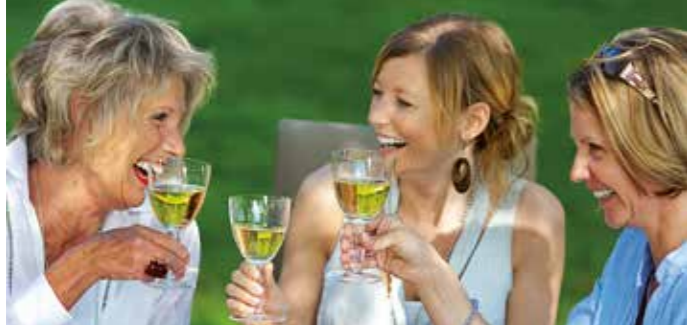
Die Verbraucher wissen heute, dass der Griff ins Weinregal auch eine Entscheidung für mehr oder weniger Umweltschutz ist.