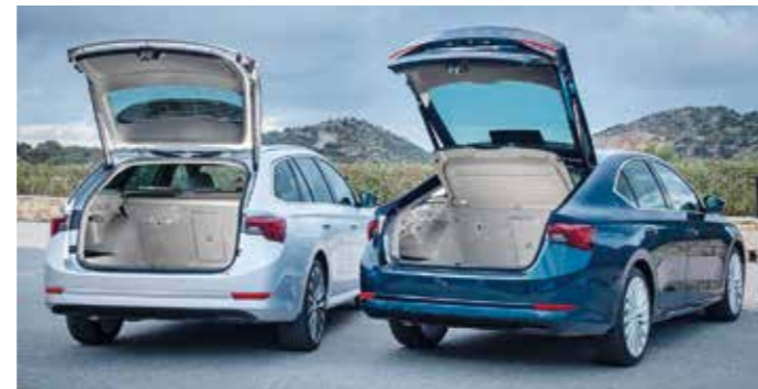
Skoda Octavia.

Technik ausgeführt. Das serienmäßige Musiksysteem Swing mit acht Zoll großem Infotainmentdisplay empfängt DAB+ gerüstet. Die neue Einstiegsversion verfügt unter anderem über eine Klimaanlage, elektrische Fensterheber vorn und hinten sowie ein schlüsselloses Startsystem. Der Octavia ist auch als Mild-Hybrid (e-Tec) sowie als Plug-in-Hybrid verfügbar.