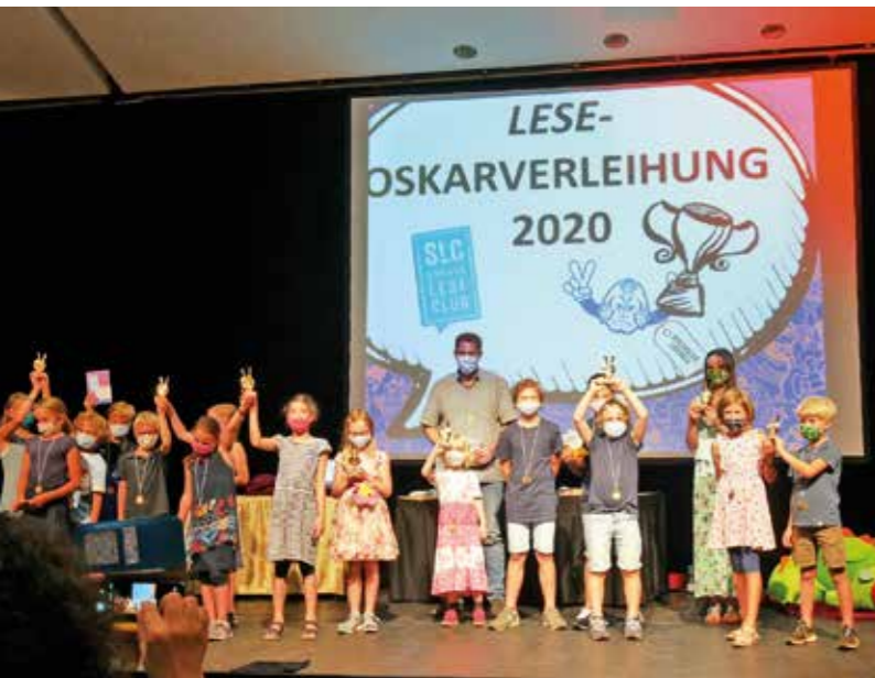
Begeistertes Publikum und ausgezeichnete Lese-Erlebnisse bei der Abschlussveranstaltung des SommerLeseClubs der Bibliothek Witten.

Am Samstag, dem 22. August, lud die Bibliothek Witten zur Abschlussfeier des SommerLeseClubs in den Festsaal des Saalbaus ein.