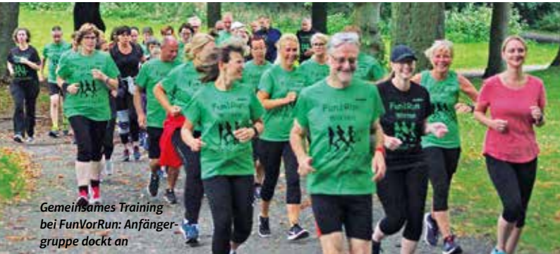
Gemeinsames Training bei FunVorRun: Anfängergruppe dockt an