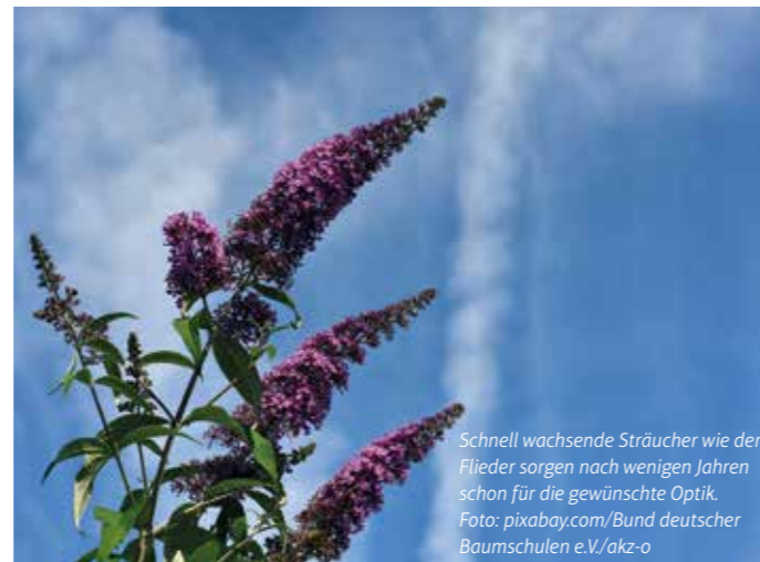
Schnell wachsende Sträucher wie der Flieder sorgen nach wenigen Jahren schon für die gewünschte Optik.