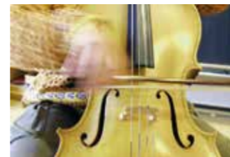
Neues Musikschuljahr startet.

Jetzt startet das neue Musikschuljahr auch wieder mit Präsenzunterricht. Die Musikschule hat dafür ein spezielles Hygienekonzept erarbeitet. Somit bestehen nun Online- und Präsenzangebote.