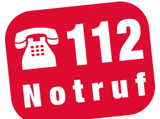
Auflösung aus der September-Ausgabe