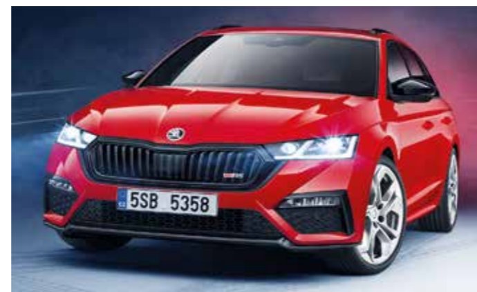
Skoda Octavia RS iV Combi.

Zum Markstart ist er als Limousine oder Kombi mit einem 245 PS starken 2,0-Liter-TSI-Motor in Verbindung mit einem Sieben-Gang-Direktschaltgetriebe zu bekommen. Ein Sechs-Gang-Schaltgetriebe sowie die 200 PS starke Dieselvariante legen die Tschechen nach. Eine First Edition zur Einführung beinhaltet serienmäßig das Infotainmentsystem Columbus. Zu den optischen Erkennungszeichen der Sportvariante des Octavia gehören unter anderem spezifische Front- und Heckschürzen, getönte Heck- und hintere Seitenscheiben, Heckleuchten in Kristallglasoptik mit animierten Blinkern sowie zahlreiche schwarze Akzente. Der Octavia RS beschleunigt in 6,7 Sekunden aus dem Stand auf Tempo 100. Die Höchstgeschwindigkeit ist bei 250 km/h elektronisch abgeregelt. Das Sportfahrwerk ist serienmäßig um 15 Millimeter tiefer gelegt.