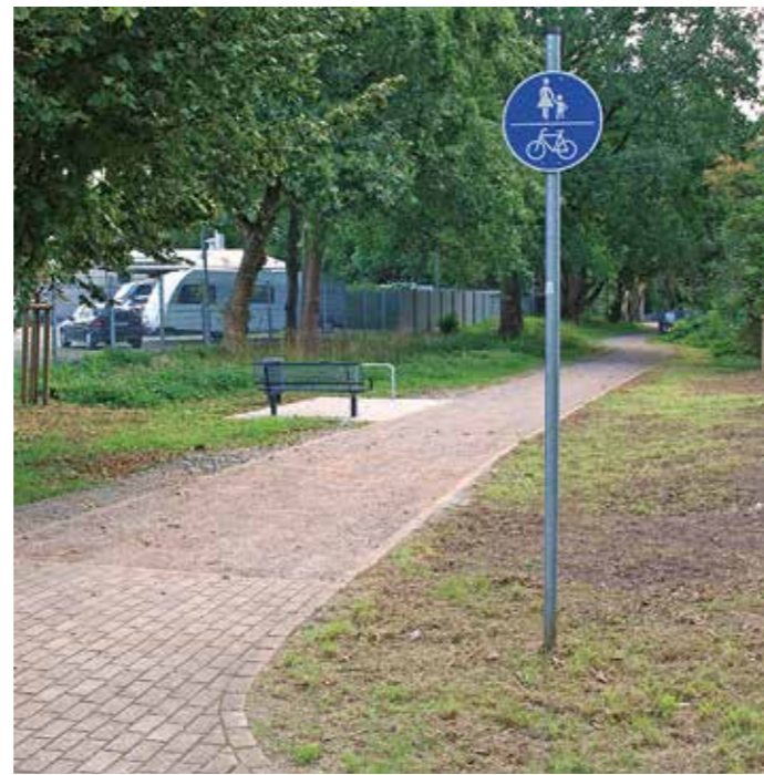
Wannern: Verbindungsweg zu Cörmannstraße eröffnet.

Die neu gestaltete Fuß- und Radwegeverbindung hat insgesamt 100.000 Euro gekostet und wurde mit Mitteln der Städtebauförderung finanziert. Es wurden Bänke, Fahrradständer und Ziegelsteine angebracht. Für mehr Biodiversität wurden neue Bäume angepflanzt. Auch die Bürgermeisterin pflanzte einen symbolischen Baum. Als Biotope und Grünfläche kann der Weg nun von den Bürgern und Bürgerinnen der Stadt Witten als attraktiver Freizeitort genutzt werden.