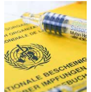
Impfungen sollte jeder Bürger in sein Impfbuch eingetragen lassen.

Die Impfung gegen Pneumokokken (Bakterien, die verschiedene Erkrankungen auslösen können, beispielsweise Lungenentzündung) wird als Standardimpfung für alle Säuglinge und Kleinkinder sowie für Menschen ab 60 Jahren empfohlen. Kinder in den ersten beiden Lebensjahren sind besonders gefährdet, schwer an einer Pneumokokken-Infektion zu erkranken - daher gilt für diese Altersgruppe die allgemeine Empfehlung zur Impfung. Eine Lungenentzündung bei Senioren wird - falls sie bakteriell bedingt ist - in den meisten Fällen durch Pneumokokken verursacht. Außerdem sind ältere Menschen ebenfalls besonders anfällig für eine schwere Erkrankung durch Pneumokokken. Aus diesem Grund gilt auch für die Altersgruppe ab 60 Jahren die Pneumokokken-Impfung