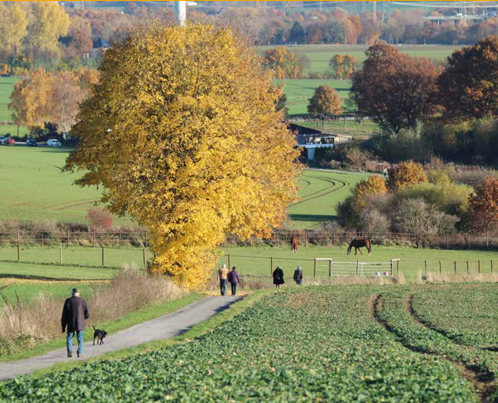
Wanderweg von Stockum nach Annen, Archivfoto

+++ 4 MONATSMAGAZINE: GESAMTAUFLAGE CA. 90.000 EXEMPLARE +++ HAUSHALTSVERTEILUNG +++ ☎ 02302 9838980 +++ WWW.IMAGE-WITTEN.DE +++