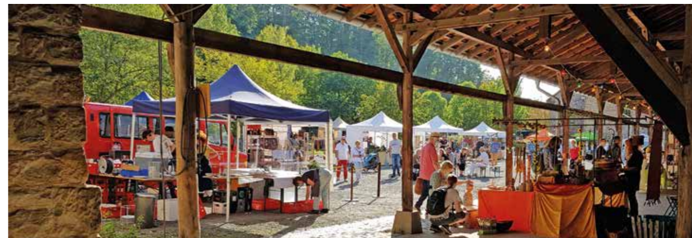
Auf dem Ökomarkt konnten Honig gekauft und Schafe bestaunt werden. Das Wetter passte und lockte viele Besucher zum diesem Ereignis.