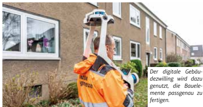
Der digitale Gebäudemessung wird dazu genutzt, die Bauelemente passgenau zu fertigen.