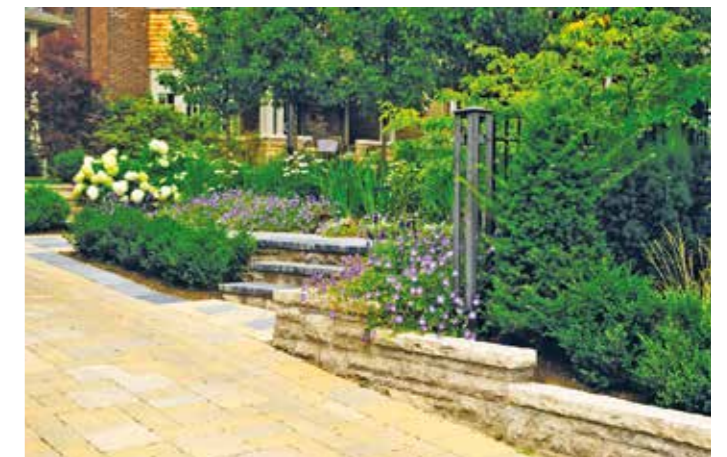
Natursteingestaltung vor einem Haus mit üppig grünem Garten.

Diese Gestaltungskriterien und Pflanzentipps können als Ausgangspunkt für die Planung und Umsetzung einer ansprechenden Vorgartengestaltung dienen. Es ist wichtig, die individuellen Bedürfnisse und Vorlieben sowie die örtlichen klimatischen Bedingungen zu berücksichtigen.