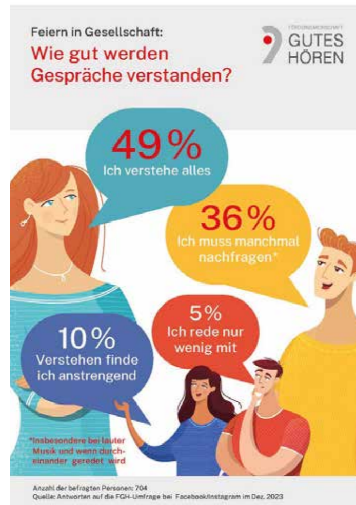
Je lauter die Umgebungsgeräusche, umso schwieriger das Sprachverstehen. In diesen Situationen kündigen sich bei vielen Menschen beginnende Hörminderungen an.

Einen Fachbetrieb in der Nähe findet man unter www.fgh-info.de .