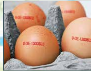
Sticht ins Auge, ist aber vielen noch ein Rätsel: der Code auf dem Ei.

Was der Code auf den Eiern über ihre Entstehung verrät