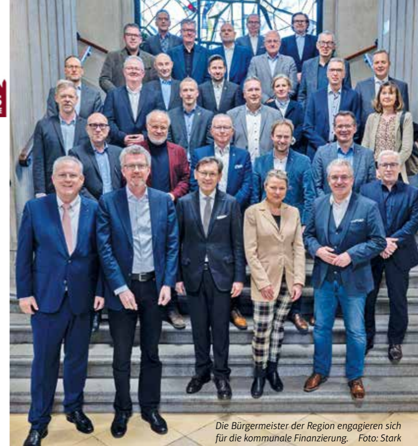
Die Bürgermeister der Region engagieren sich für die kommunale Finanzierung.

Die Konferenz appellierte an die NRW-Landesregierung, endlich die im Koalitionsvertrag versprochene Altschuldenlösung vorzulegen und zum 1. Januar 2025 umzusetzen. NRW ist das einzige Bundesland, das noch keine Lösung für seine finanzschwachen Kommunen gefunden hat.