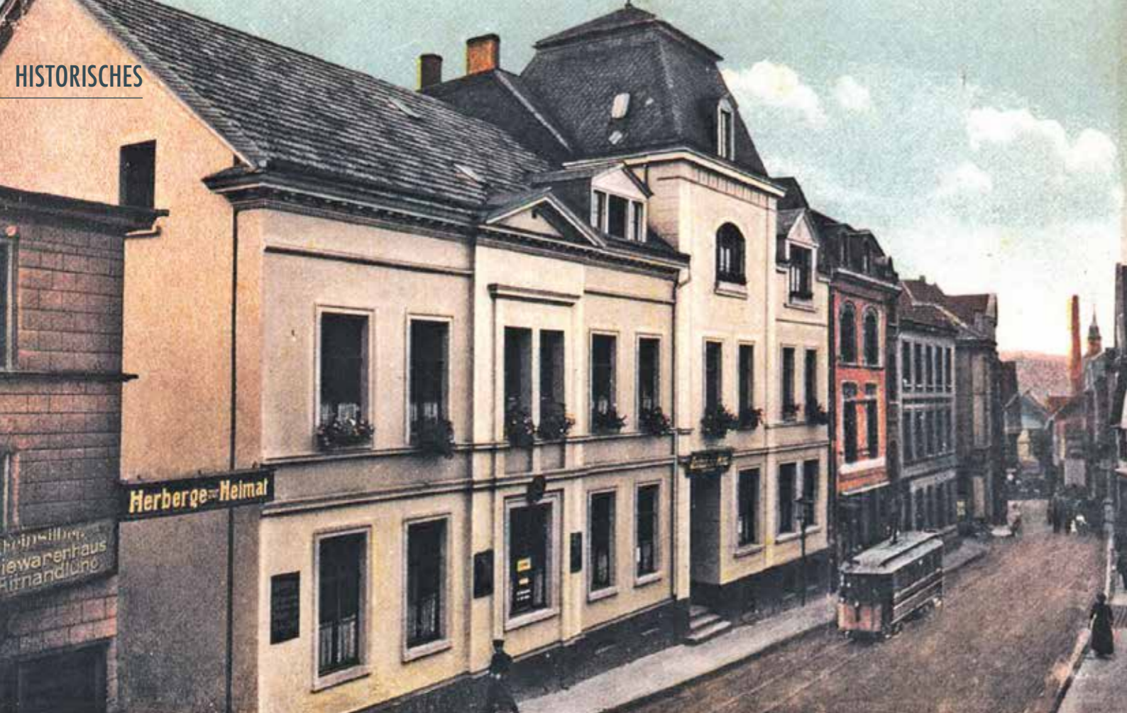
Die „Herberge zur Heimat“ in der Heggerstraße 22 (heute dm) um 1910. Die Straßenbahn ist im Verhältnis zu Haus und Menschen nicht maßstabgetreu. Hinten rechts sieht man den hohen Schornstein der Brennerei Weygand und den Glockenturm der Johannis-Kirche.