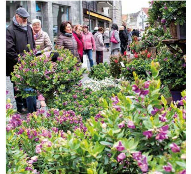
Hattingen lockt wieder mit dem Frühlingsfest in der Innenstadt.

Weiter geht's zu einem der nächsten schönen Plätze in der Hattinger Altstadt, dem Krämersdorf. Hier sorgt die Schlemmermeile für das leibliche Wohl. Frischer Spargel, Flammlachs, Nudeln aus dem Käselai, Fisch und Feines vom Grill – hmmm, da läuft einem schon heute das Wasser im Mund zusammen. Die gemütliche Atmosphäre des Platzes lädt zum Verweilen und Genießen ein.